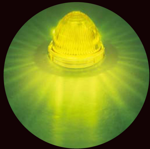
夜間点灯イメージ