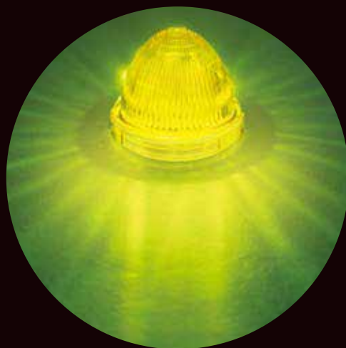
夜間点灯イメージ