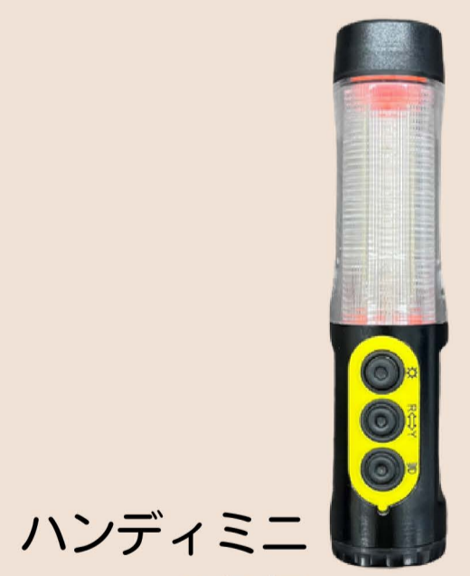
ハンディミニ 2色灯