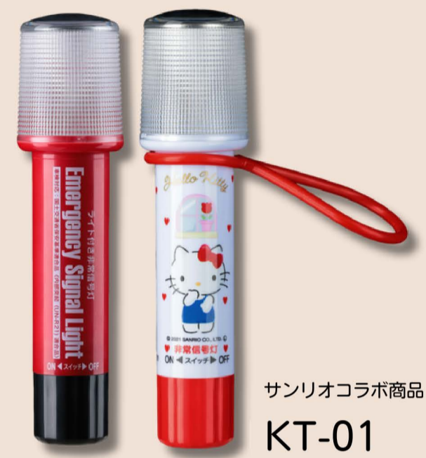
サンリオコラボ商品 KT-01